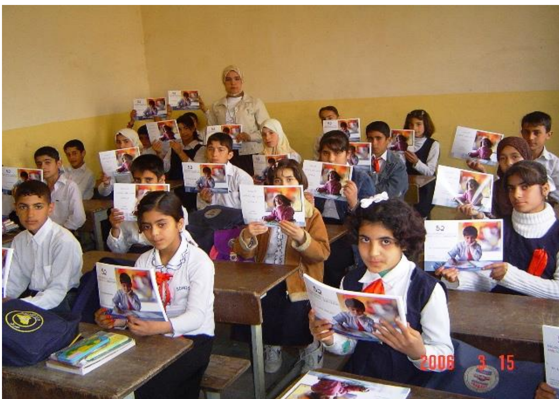
Boken (52 spørsmål) ble delt ut i 5. klasse på Dimdim skole i Kerkuk provinsen- Kurdistan i 2006

Denne boken inneholder 52 spørsmål (på kurdisk språk) til de 52 ukene i året. Det er en måte å holde barna tenker uten å holde dem borte fra andre skolenarbeid. Dette er moro og en enkel måte å starte filosofi med barn. Med spørsmålene, ble det gitt fire muligheter eller alternativer for barn å jobbe med saken, (skrive, spør, tegne, tror jeg) Hvert spørsmål må skrive ut på et A4-ark, som barn har nok plass til å tegne, eller skrive hva de mener.