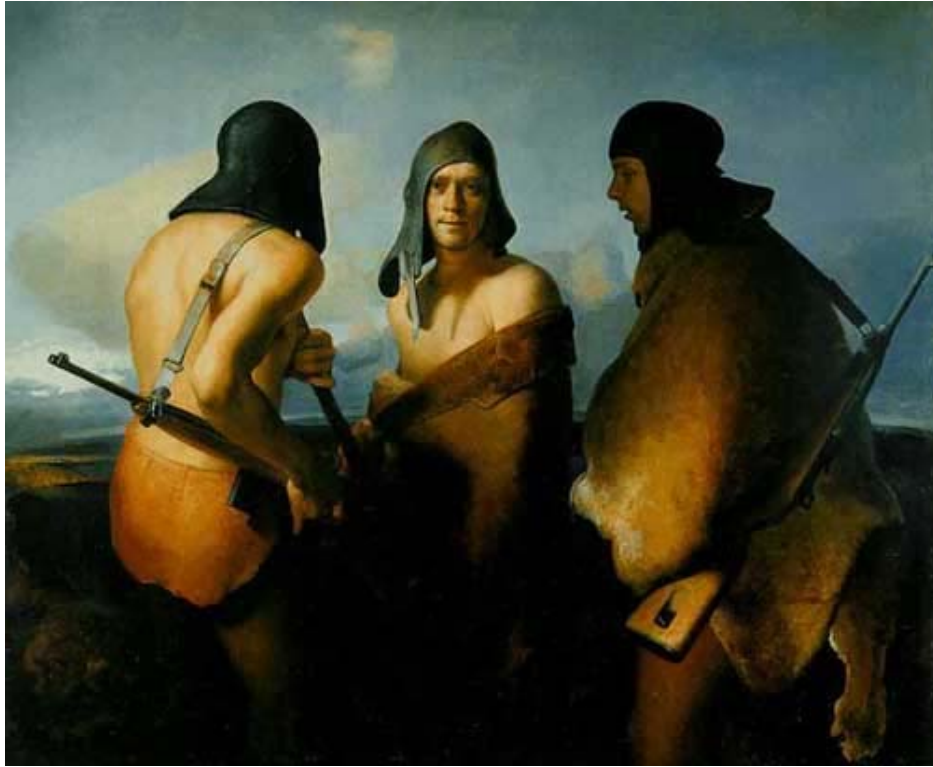
سه‌چاوهی ئەم بابەتە میدیای نەرویجی، وێنە پێدیا و گوگله‌یه.