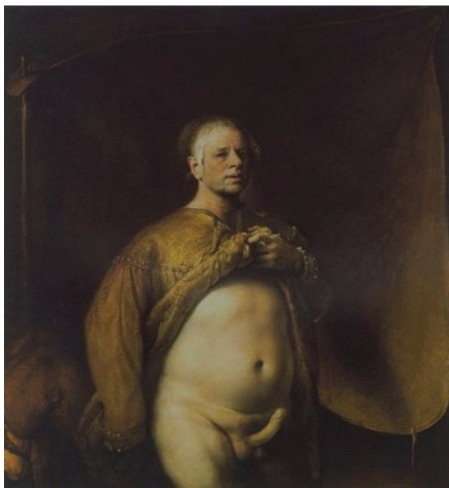
پۆرترێتی خۆی 1999

هەندیک له تابلۆکانی گووتوبیژی سەختی له میدیا و له نیوەندە هونەرییەکاندا ئافرانوو، وەک ئەم پۆرترێتی خۆی. چەند تابلۆیەکی زۆر لەمەش (سەیرتری!) هەیە، دەتوانیت له گوگلەئیمجس - دا ببینیت.