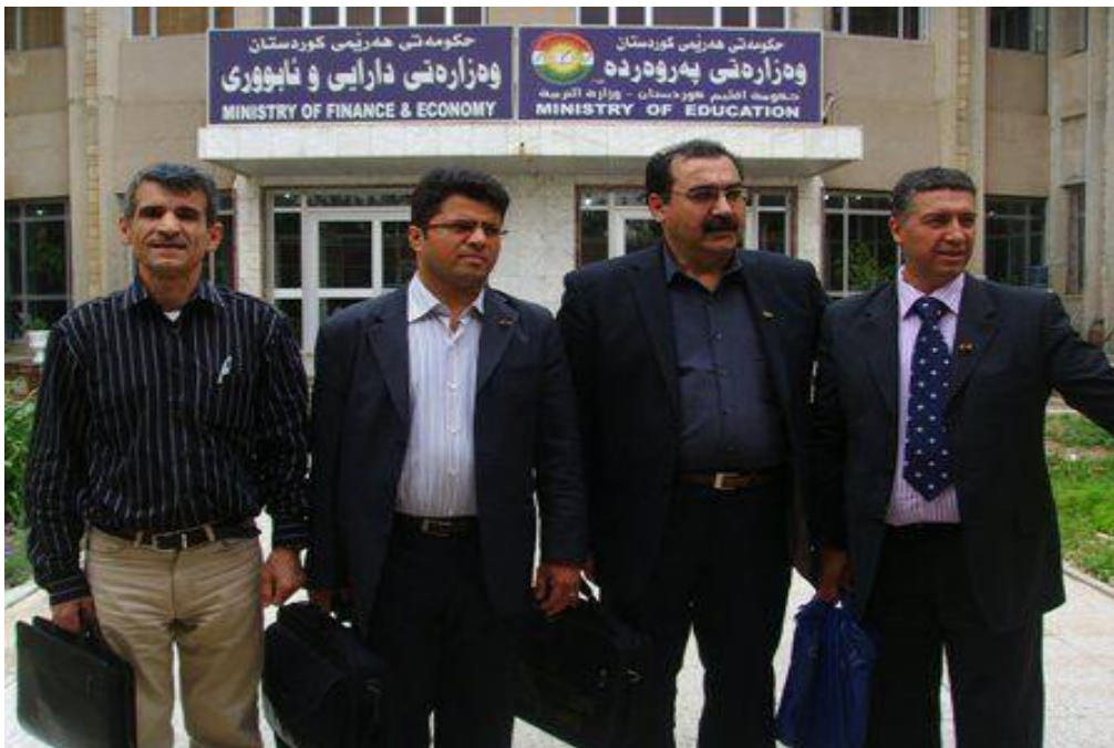
كهرىم مستهفا و چهند مىوانىكى كۆنگرهى پەرورده، سالى 2007

مىوانانى كۆنگره، بابهتهكانى خۆيان خويندوهه. چهند كهسنىك له چهند ولائىكهوه، (هۆلاند، دانىمارك، ئالمانىا، سوئد و نهروىج) هاتبوون. بابهتهكان ههمهجوو بوون، ههر له پىشنىار بۆ گۆرىنى سىستهمى فىركارى و بابهتى زمانهوانى، فىركارى هاوچهرخ، تىئورى فىركردن، فىركردنى شىوازى بىركردنهوى فەلسەفى له لای مندا، خويندنى ناين و رىچكه ناينيه جوداكان(نهك ههر بهتهنها ناينى ئىسلام)، دانانى مندا له چەقى سىستهمى فىركارىدا، تا بهرئوهبردى فىركه به شىوازىكى هاوچهرخ. تهرخانكردى نهم بهشهى كۆنگره بۆ مىوانان بهو مەبهسته بوو، تا ئامادهبووانى كۆنگره، به شىواز و دىد و بۆچونى نوئى و لاتانى پىشرهفتهى ئهوروپا ئاشنا بن و وهك نمونه يهك كهلكى لئوهربگرن.