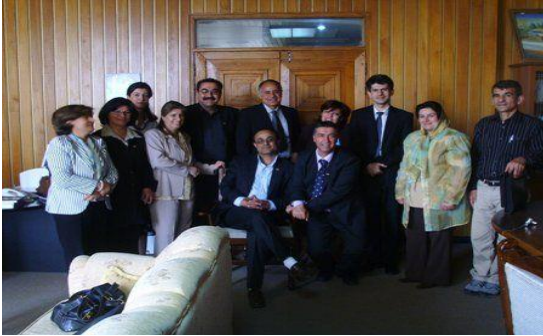
چهند ميوانى كۆنگره له گهمل ليزنهى پهروهرده له په رلمانى كوردستان، سالى ۲۰۰۷