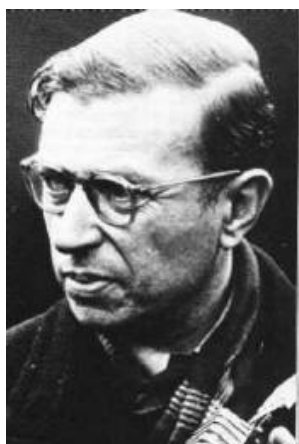
Jan Paul Sartra

بههمهن عوبید، پولى پینجهه، له فیږگه‌ی «قه‌لای دمدم» (فیږگه‌ی ژیر چادر) له که‌رکوک، بوی نووسیوم: « به بروای من گهر پرسیار کردن نه‌بوايه، ژيان ئالۆزتر ده‌بوو؛ چونکه هه‌تا پیرسین شتی زیاتر فیږ ده‌بین. گهر پرسیار کردن نه‌بوايه فیږی هیچ نه‌ده‌بووین.»