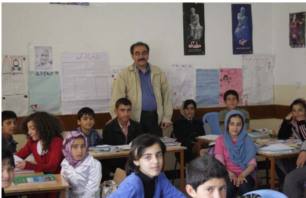
پۇلى شه‌شه‌مى بنه‌ره‌تي، له فيرگه‌ي ده‌لalan (نزىك قه‌زاي رانيه) سالى 2011