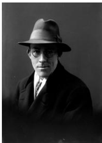
Peter Wessel Zaffe

فه‌یله‌سووف، پیتته‌ر ویسیل زایفه، ده‌لیت: « ئه‌وه له سروشتی مرؤفدایه که به‌دوای مانادا عه‌قدال بیت، دیچوون به‌دووی مانا، خه‌سله‌تی مرؤفانه‌یه.»